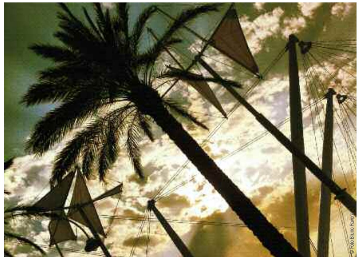
Il programma potrebbe subire variazioni non prevedibili al momento della stampa.